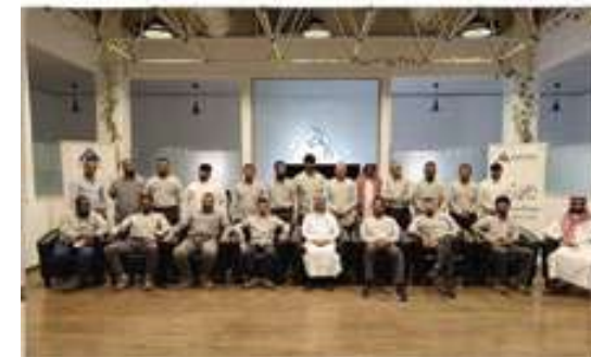
برامج تطوير للموظفين