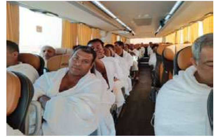
برنامج رحلة العمرة للموظفين