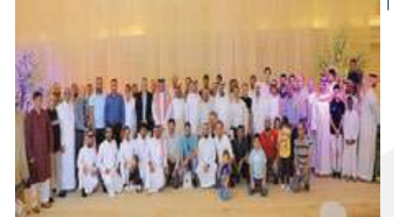
برنامج الإفطار الرمضاني للموظفين