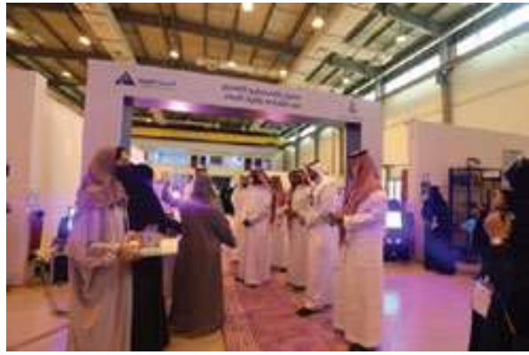
برنامج المعرض الأول لطالبات كلية الهندسة