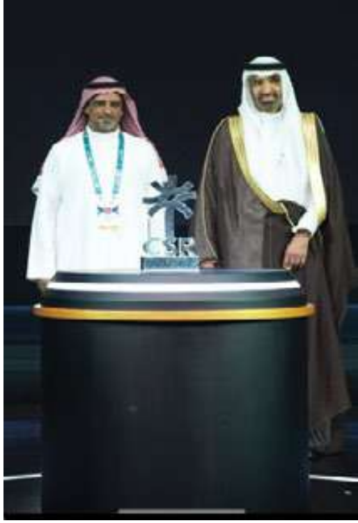
جائزة المسؤولية الاجتماعية للشركات لعام ٢٠٢٤ م

وقد أطلقت وزارة الموارد البشرية والتنمية الاجتماعية في عام ٢٠٢٤ م جائزة المسؤولية الاجتماعية للشركات في نسختها الأولى بهدف تكريم وتحفيز شركات ومؤسسات القطاع الخاص وتسليط الضوء على الجهود المحلية في تفعيل ممارسات المسؤولية الاجتماعية وفقاً للمعايير الدولية وتنمية لروح التنافس في هذا القطاع واستحداث نماذج يحتذى بها في قطاع الأعمال، وتم تكريم شركة الأسمنت العربية ومنحتها جائزة تبني الفرص على منصة المسؤولية الاجتماعية بوزارة الموارد البشرية والتنمية الاجتماعية.