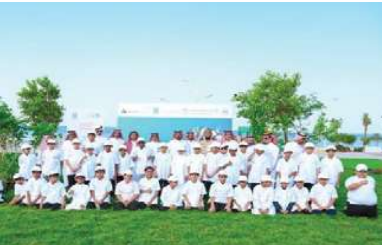
المساهمة في التوعية في أسبوع البيئة