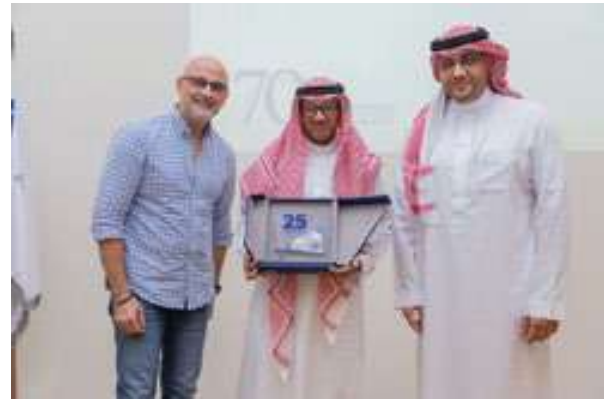
برنامج تكريم الموظفين ممن خدموا الشركة لأكثر من ٢٥ عاما