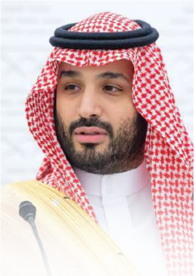
صاحب السمو الملكي الأمير محمد بن سلمان بن عبدالعزيز آل سعود ولي العهد ورئيس مجلس الوزراء