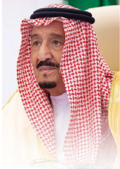
عَلَّمَ اللَّهُ الْكِتَابَ تَتْلُونَهَا الملك سلمان بن عبدالعزيز آل سعود يحفظه الله