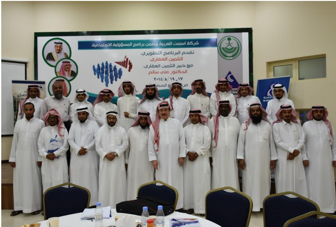
( برنامج تطويري في التثمين العقاري )

حرصت شركة الاسمنت العربية على زيادة الأنشطة والفعاليات التي أقيمت في مركز رابغ الحضاري خلال عام ٢٠١٥م حرصاً منها على خدمة المجتمع المحلي في مدينة رابغ عن طريق تقديم مختلف الدورات التدريبية والمحاضرات القيمة التي تلامس احتياجاتهم المعاصرة والتي تركز على مختلف الفئات العمرية، بالإضافة إلى استضافة كافة مختلف المناسبات الاجتماعية والرسمية والأيام العالمية ومنها على سبيل المثال لا الحصر محاضرات متنوعة عن صناعة الاسمنت لطلاب المدارس والقيادة الآمنة والسلامة المنزلية، الأيزو، الصحة والسلامة المهنية ودورات تدريبية في إدارة الوقت، المشروعات الصغيرة، كيف تختار تخصصك الجامعي، التعامل مع ذوي الاحتياجات الخاصة، التثمين العقاري، إدارة الذات والنجاح الوظيفي وفعاليات حكومية واجتماعية من تكريم متقاعدي و متميزي شرطة رابغ، برنامج الأمن الفكري، أسبوع المرور الخليجي، تكريم الطلاب المشاركين في الأنشطة الاجتماعية، تكريم متقاعدي شركة الكهرباء، تكريم الأخوة حديثي الإسلام، دورات رياضية في كرة القدم، افطار صائم في الشهر الكريم وغيرها من البرامج لتكون جزء لا يتجزأ من المجتمع.