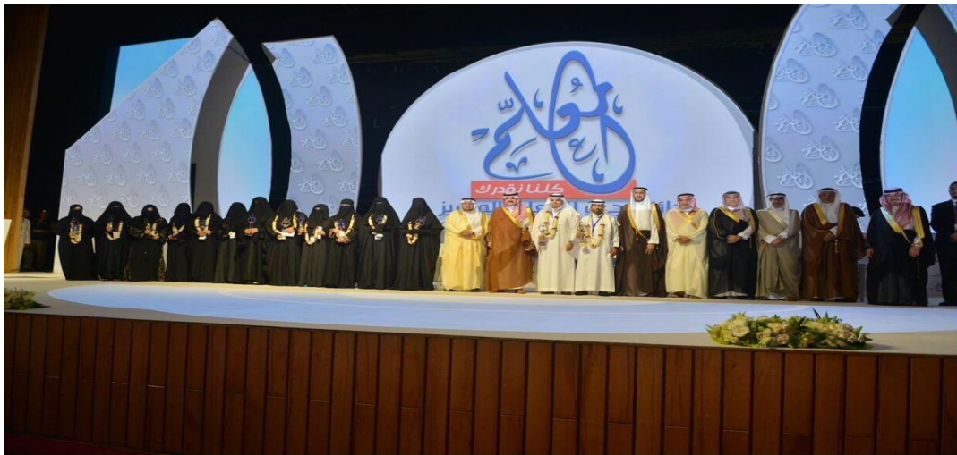
( جائزة جدة للمعلم المتميز )

بفضل من الله إنطلقت النسخة الأولى والثانية والثالثة من الجائزة بتطوير مستمر في آلياتها التي تساعد على تحقيق أهدافها والتي جاءت لإظهار تقدير المجتمع لجهود المعلم/المعلمة وتفعيل دور المعلم ورفع حماسه واعتزازه بمهنته ونشر ثقافة التميز وتعميقها لدى المعلمين وعرفاناً بدورهما التعليمي والتربوي الذي يساهم في نهضة الوطن من خلال بناء أجيال تلبي احتياجاته وتطلعاته نحو مستقبل مشرق بإذن الله وعلى أن تكون الجائزة داعية للإنجاز ومحفزة للإبداع حيث تدرج معها مسابقة رسالة إلى معلم ومسابقة كلنا نقدر كالتقدير الفني لتفعيل دور الطلاب وذويهم في تقدير المعلم ودوره السامي.