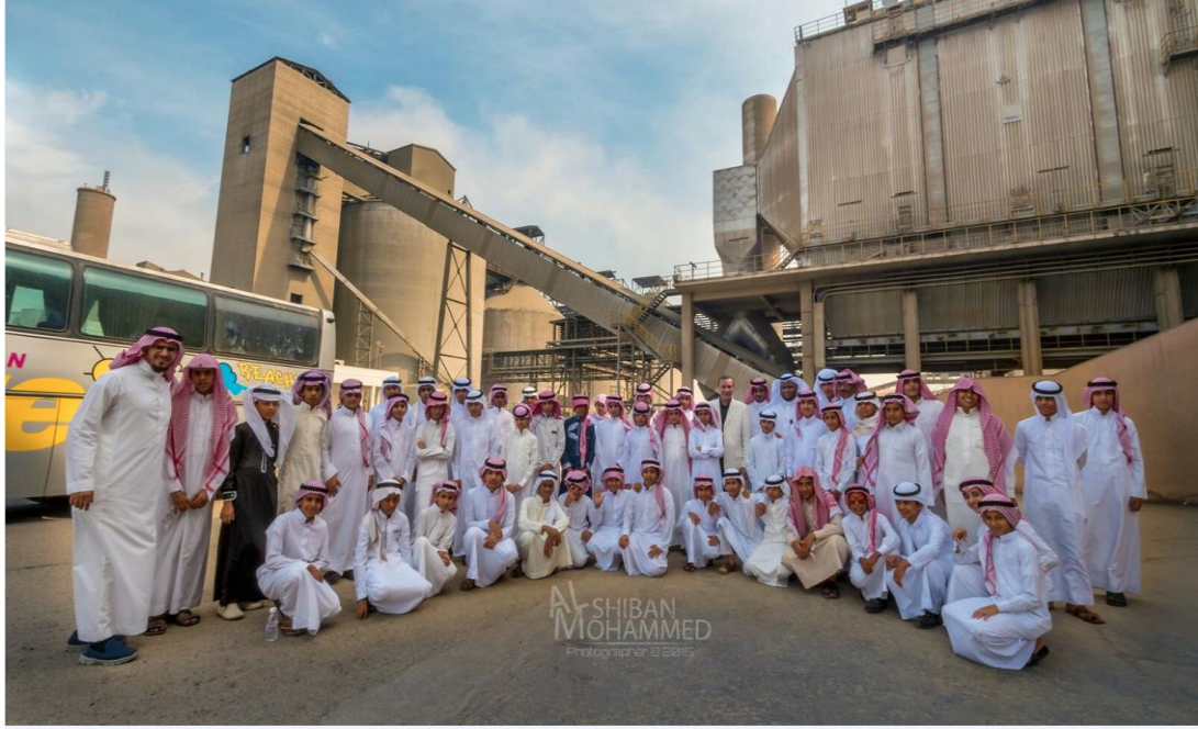
( تنظيم الزيارات الميدانية لطلبة المدارس للتعريف بصناعة الاسمنت )