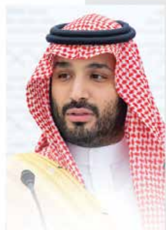
صاحب السمو الملكي الإمام محمد بن سلمان بن عبدالعزيز آل سعود ولي العهد نائب رئيس مجلس الوزراء وزير الدفاع