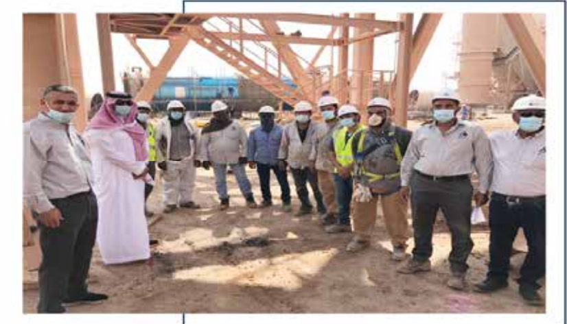
الإحتفاء بإنجاز الصيانة السنوية

في عام ٢٠٢٠ تماشيًا مع الجهود التي بذلتها المملكة العربية السعودية لمكافحة تفشي فيروس كورونا المستجد (COVID-19)، ومؤازرةً لمبادرات وزارة الصحة لمواجهة هذه الازمة العالمية واستشعارًا للمسؤولية الوطنية قدمت شركة الاسمنت العربية دعماً لصندوق الوقف الصحي في وزارة الصحة بمبلغ ٢ مليون ريال، كما واصلت الشركة الدعم للمجتمع المحلي أثناء جائحة فيروس كورونا المستجد (COVID-19) حيث تبنت العديد من البرامج والمبادرات لخدمة المجتمع.