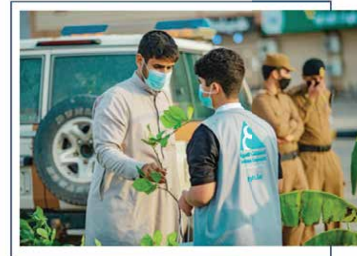
أحياء رايغ الخضراء