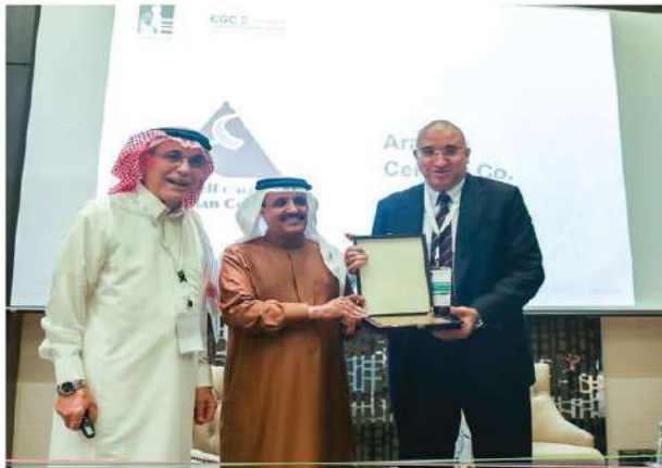
تسلم الشركة لدرع الحصول على المركز الأول في تطبيق الحوكمة من مدير جامعة الفيصل وعميد كلية إدارة الأعمال

حقوق المساهمين، حقوق أصحاب العلاقة من غير المساهمين مثل الموظفين والعملاء والموردين والبيئة الطبيعية والاجتماعية.