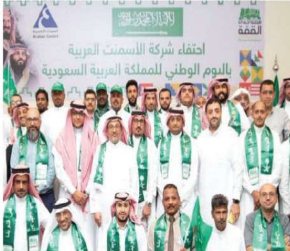
الاحتفاء باليوم الوطني للمملكة العربية السعودية الـ٨٩

قدمت الشركة العديد من البرامج التدريبية والترفيهية لأسر موظفي الشركة مما ينعكس على زيادة إنتاجية الموظفين، وستواصل الشركة سعيها لخدمة المجتمع ، لتصنع تأثيراً يساهم في تقديم مبادرات لتطور المجتمع معرفياً واقتصادياً .