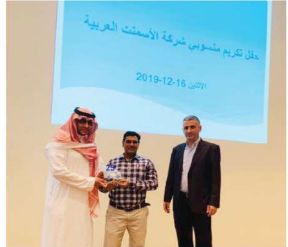
حفلة تكريم منسوبي شركة الأسمنت العربية