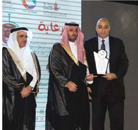
رعاية مهرجان المملكة بألوان العالم بمركز الملك عبدالله بن عبدالعزيز لرعاية الأطفال المعوقين بجدة