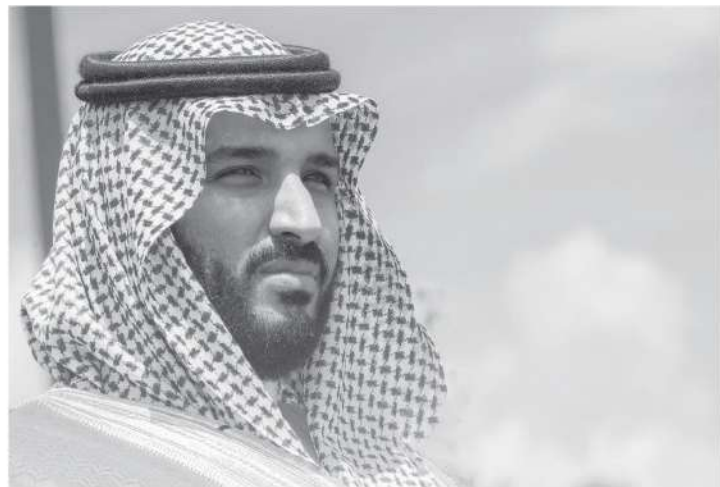
صاحب السمو الملكي الأمير سلطان بن عبدالعزيز آل سعود ولي العهد نائب رئيس مجلس الوزراء وزير الدفاع