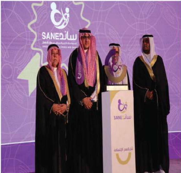
رعاية وتشجيع جمعية ساند لمرضى سرطان الأطفال

كما حرصت الشركة خلال عام ٢٠١٩م على دعم الجمعيات التي تعتنى بهذه الشريحة عبر برامج تهدف لدمج ذوي الاحتياجات الخاصة في المجتمع ، ومن هذه الجمعيات (مركز الملك عبدالله بن عبدالعزيز لرعاية الأطفال المعوقين بجدة – أكاديمية التوحد الرائدة – مركز بادغيش للرعاية والتأهيل ) .