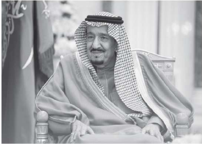
الملك عبد الله الثاني بن الحسين ملك الأردن بِحفظه الله